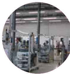
GEWERBE / INDUSTRIE