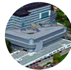
KRANKENHÄUSER & REHAZENTREN